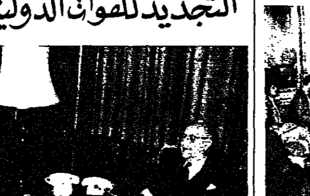
ابى الملمع مع وفد المنظمات الدولية

استقبل الامين العام لوزارة الخارجية والمغتربين السفير فرقوق ابي... اللومع وفد المنظمات الدولية... التي يزور لبنان برئاسة... ممثل الامين العام للأمم المتحدة لشؤون... والتنمية في اقليم الشرق والشرق... غومبولتون وروجر ابي جيفال والذين... القتم الاستقبالين السادة الدكتور... بيق الله فرقوق. جبران صوفل ونوال... فقال